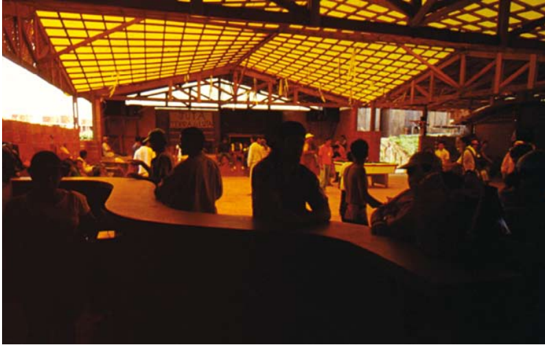
—Centro comunitário do Mutirão 26 de Julho, São Paulo—

histórico em que se realizaram. Mas tiveram o mérito de indicar alternativas, de experimentar possibilidades, de recusar o inaceitável.