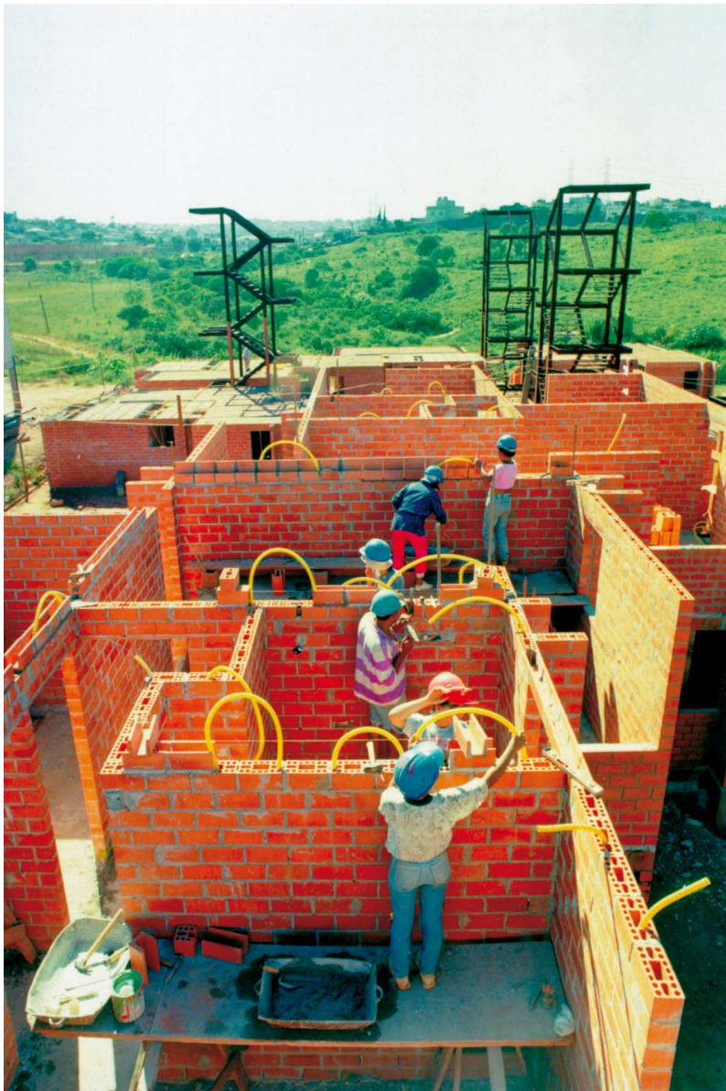
—Construção do mutirão União de Jataí, com a adoção de torres de escada metálicas, São Paulo—