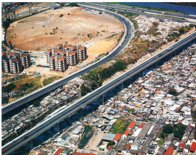
—Viaduto sobre o rio Tiête, São Paulo—

registros oficiais ou recolha de impostos. No lote ilegal, a casa é construída pelo esforço dos moradores que, nos seus dias de folga, ou mesmo à noite, erguem o abrigo que o seu pequeno salário não lhes permite comprar. A técnica é a mais rudimentar, os materiais, os mais baratos. O que é para ele a produção de um valor de uso, entretanto, representa socialmente uma economia para o capital. A fuga ao aluguer reduz o custo de reprodução da força de trabalho e a sua pressão pelo aumento de salários. Nas favelas, ironicamente, quase todos são «proprietários».