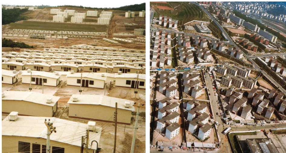
—Manifestações da forma-conjunto: Casas-embrião evolutivas & Cidade Tiradentes, São Paulo—

gratuitos na melhoria dos seus bairros e casas, dentro de programas de urbanização de favelas, de regularização fundiária e de produção de lotes urbanizados com habitações evolutivas (pequenas «casas-embrião», para serem ampliadas futuramente). Alguns dos resultados revelavam os limites dessa alternativa de baixo custo: as moradias produzidas chegavam a ter menor área por habitante do que celas prisionais e, para ser admissível, os códigos de obra e de urbanização tiveram de ser «flexibilizados».