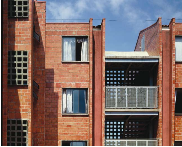
—União de Juta: torre da escada é incorporada no corpo do edifício—

Em novo zoom , vamos encontrar as associações e cooperativas de construção debatendo no seu dia-a-dia com arquitectos e engenheiros cada um dos seus projectos e obras, em assembleias e reuniões sucessivas com as famílias interessadas. Por meio de várias dinâmicas que socializam o conhecimento dos técnicos e os abrem para compreender as necessidades e anseios da população, nasce um projecto que vai sendo apresentado através de maquetes, desenhos e protótipos. A gestão da obra é definida em grandes linhas, por meio de um regulamento interno, no qual os construtores deliberam as regras que irão orientar o seu trabalho. Entre elas estão: a equivalência entre trabalhos, a igualdade de obrigações, a rotação de tarefas e a aprendizagem de todas as etapas de produção da obra. Seja na cooperativa uruguaia, mais politizada, ou na associação de construção brasileira, mais cristã-solidária, compreende-se que o momento de trabalho está organizado por regras e escalas diferentes das da empresa capitalista.