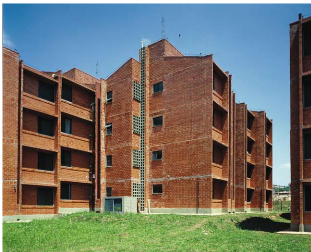
—União de Juta: blocos cerâmicos aparentes revelam o índice do trabalho—

como índice do trabalho realizado. A modulação é estrita em respeito ao produtor, evitando cortes e retrabalhos. As instalações permeiam as alvenarias com o mínimo de interferência, articulando as diferentes equipas num único ritmo. Em alguns projetos de São Paulo, foi adoptado um sistema construtivo próprio para a produção de edificações verticais: alvenarias auto-portantes em blocos cerâmicos estruturais, que dispensam o complexo e penoso serviço de montagem de formas, armaduras e betonagens de vigas e pilares; e a implantação de torres de escada metálicas logo após a fundação, de modo a garantir o transporte seguro de pessoas e materiais, além de fornecer prumo e nível para a construção. Nessas obras há quase uma reconciliação entre desenho e estaleiro, entre o produtor e a sua obra, uma forma de construir que foi negada e quebrada pela produção capitalista—não custa lembrar que a construção civil hoje, entre os diversos ramos industriais, concentra os mais baixos salários, as jornadas mais longas, o menor nível de sindicalização e o maior número de acidentes.